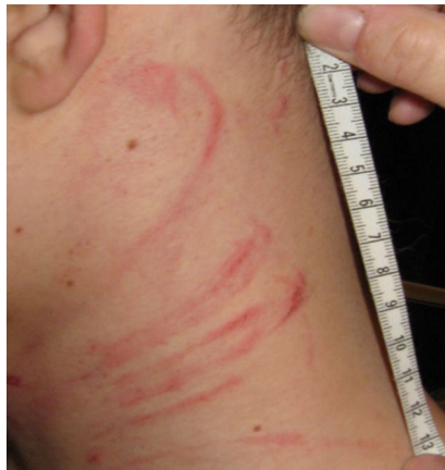
Abb. 4 ▲ Mehrere schlingenförmige Hämatome z. T. mit Abloderung der Oberhaut im Bereich der linken Halsseite

lich ist – eine Kontaktaufnahme mit dem Jugendamt wird hier meist z. B. geplant am nächsten Werktag erfolgen können. In milderen Fällen ohne akute Gefährdung umfassen die Interventionen des Jugendamtes eher Hilfsangebote zur Stärkung familiärer Ressourcen. Die Weitergabe dieser Informationen an die Zielklinik ist somit von größter Bedeutung. Häufig weisen chronisch vernachlässigte Kinder auch eine deutliche Entwicklungsverzögerung auf und bedürfen einer gezielten, intensiven Förderstrategie z. B. an einem sozialpädiatrischen Zentrum oder einer Frühförderereinrichtung. Solche intensive, medizinische und psychosoziale Betreuung kann dann wiederum durch den regelmäßigen Kontakt auch die Sicherheit der Kinder besser gewährleisten.