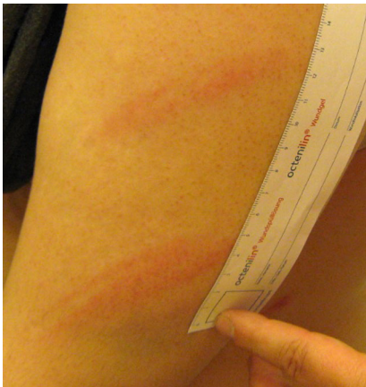
Abb. 3 ▲ Zwei parallel angeordnete Erytheme mit zentraler Abblassung (Doppelstriemen)