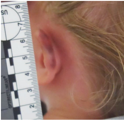
Abb. 1 ▲ Hämatome retroaurikulär und am Hinterrand der Helix des linken Ohrs