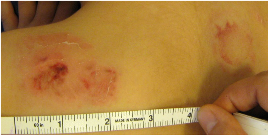
Abb. 5 ▲ Zwei bogenförmig angeordnete Hämatome mit oberflächlichen Hautabschürfungen im Randbereich und zentral deutlicher Einblutung (Sogwirkung), beachte den Maßstab in Zoll statt cm